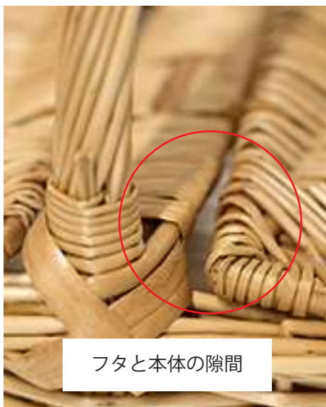
フタと本体の隙間